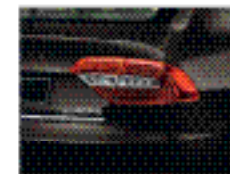
Задние светодиодные фонари.