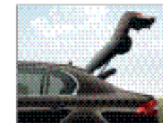
Две кнопки для открытия багажника в разных режимах.