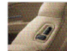
Регулировка переднего пассажирского сиденья сзади.*