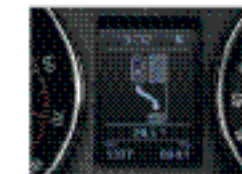
Новое поколение ассистента парковки.*