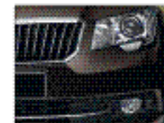
Би-ксенонные фары APS II со светодиодными ходовыми огнями.

Ждем вас в официальных дилерских центрах ŠKODA.